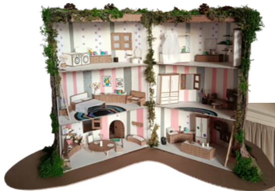
↑ Kateřina Vrtílková, 3. GDO B