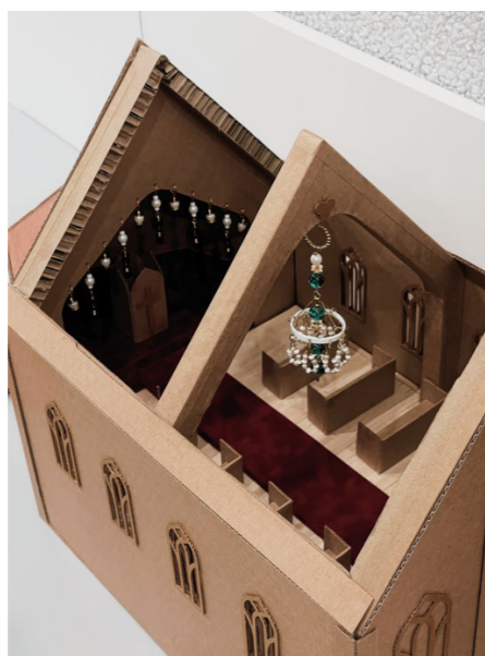
↑ Aneta Kimmerová, 4. GDO